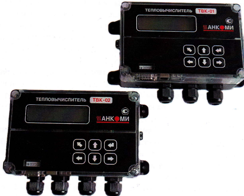
Рисунок 1 - Общий вид исполнений ТВК

Общий вид исполнений ТВК, представлен на рисунке 1.